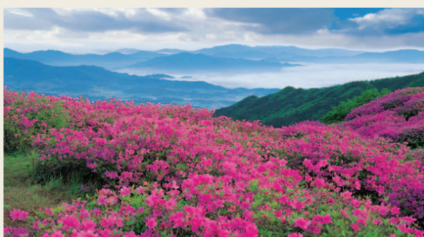
■ 탁상 A형(풍경)과 사진 동일