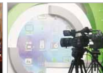
▲ HD 방송 스튜디오 ▲