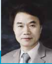
서울대학교 법학박사 벨기에 카톨릭루브대학교 법과대학원 LL.M 한국스카우트연맹 이사, 국회사카우트의원연맹 감사 소비자시민모임 이사 前) 국회사무처 정책조사관, 법제연구관 역임