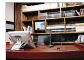
▲ 무인 자동화 스튜디오