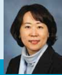
동덕여자대학교 대학원 경영학과 박사(마케팅) EBS 한국교육방송공사 리포터, 아나운서 통일연구원 연구위원, 조달청 평가위원 정보통신진흥원 콘텐츠 평가위원 역임 경북대, 동덕여대, 동양미래대학, 강남대 강사

교정학개론, 사회문제론, 보호관찰론, 교정교육론, 성격심리, 범죄심리학, 교정복지론